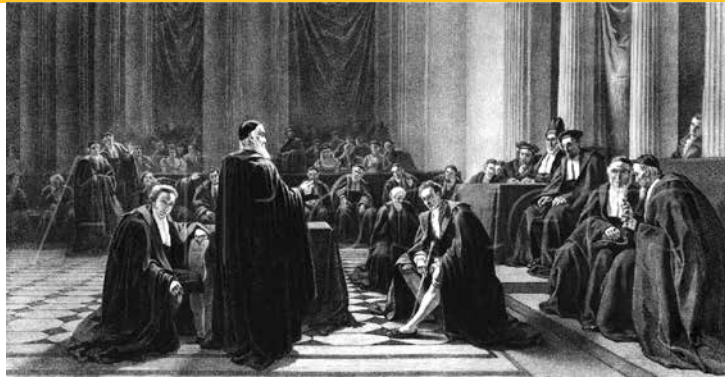
MUSÉE D'ART ET D'HISTOIRE DU JUDAÏSME, PARIS