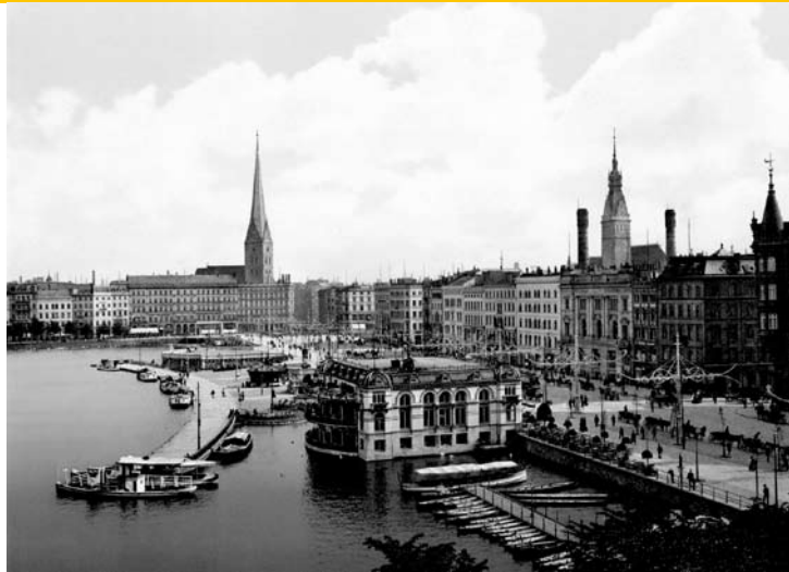
Hambourg vers 1900