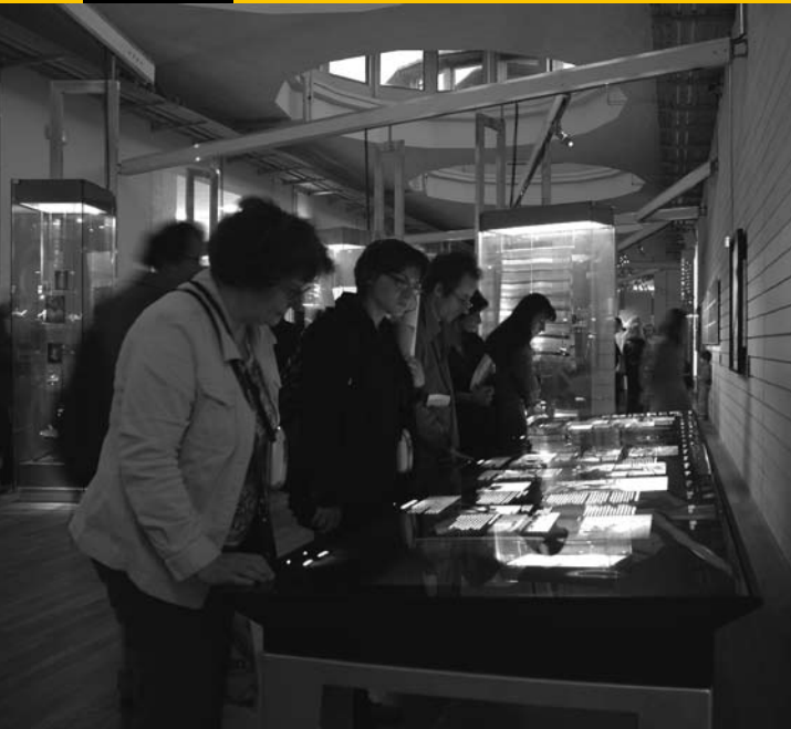
Exposition permanente de la Cité de l'immigration