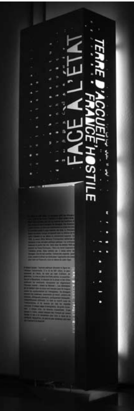
Dans les salles...

pays... Mais quand je pense aux Républicains espagnols qui ont traversé les Pyrénées en 1939, qui ont gelé sur les plages d'Argelès avant d'être internés dans des conditions souvent épouvantables, et que je vois, quelques mètres plus loin dans notre exposition, les photos de ces Africains qui acceptent de risquer leur vie pour parvenir aux Canaries et de là en Europe (ou que je prends connaissance de leurs récits), je constate que, d'une certaine façon, comme on dit, rien n'a changé sous le soleil !