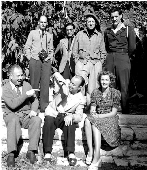
Joseph Kosma (2 e en haut à gauche), Jean Gabin (3 ème en haut), Marcel Carné (en bas au milieu), probablement à Tourette/Loup en 1945, pendant la préparation des Portes de la Nuit .