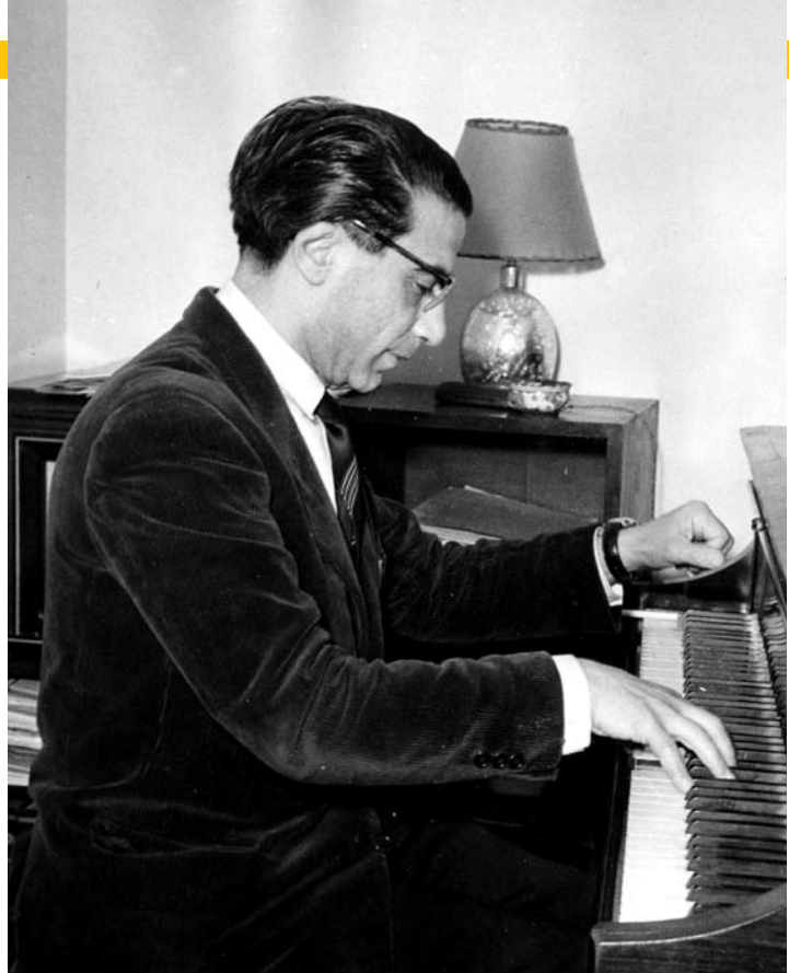
Joseph Kosma au piano

L'œuvre de Kosma est énorme, immense. Immense et presque oubliée aujourd'hui. À croire qu'à l'instar des héros de la pantomime, tout chez Kosma était destiné à se fondre puis à disparaître dans une sorte d'inconscient collectif où bien moins que sa part lui serait reconnue. Comme si l'intelligence discrète de l'homme était allée de pair avec le risque pour l'artiste de passer inaperçu. En construisant mon spectacle, je m'étais demandé si j'allais y inclure ou non telles quelles Les Feuilles mortes , son unique vrai succès