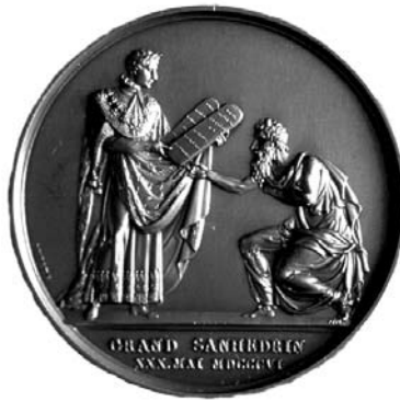
Médaille du Grand Sanhédrin. Paris, 1806, bronze, Fonte contemporaine

Tout se déroule alors dans des formes ostentatoires faites pour les seuls Juifs : convocation d'une assemblée de notables, que suivra, fait inouï, la réunion d'un organisme dit « Grand Sanhédrin » selon la terminologie antique 5 . Plus encore, dans le dialogue qui se noue entre ces assemblées et le pouvoir, c'est ce dernier seul qui donne le ton et connaît les règles du jeu. Les autorités juives sont sommées de se prononcer sur des questions qui ne sauraient être posées