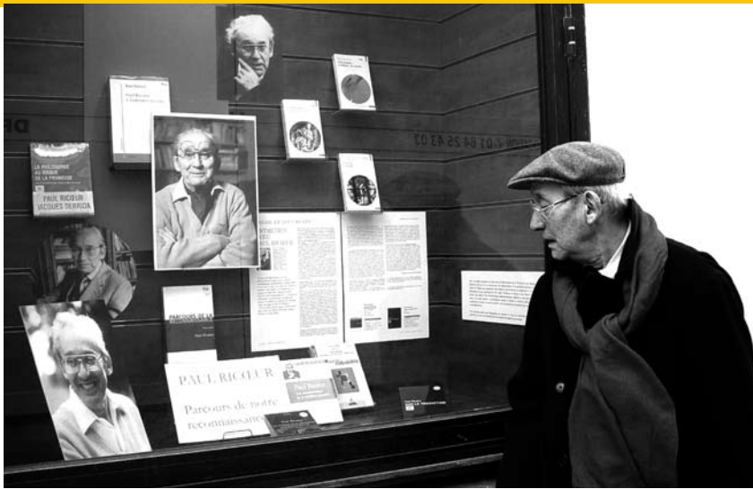
Paul Ricœur devant la librairie La Procure à Paris, mai 2004, à l'occasion de la sortie de son livre Parcours de la reconnaissance .