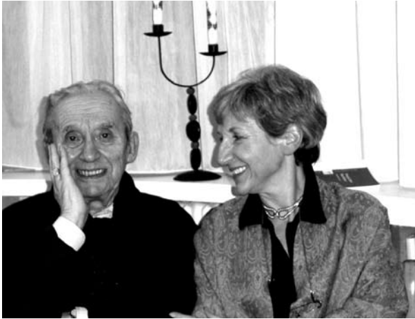
Paul Ricoeur et Catherine Goldenstein 5 , 2003.