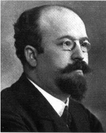
Bernard Lazare (1865-1903).

si, pour quelques pays du moins, les causes générales que j'ai tenté de déduire persistent encore, et si ce n'est pas ailleurs qu'il nous faudra chercher les raisons de l'antisémitisme moderne ». Le développement ultérieur de cet usage abusif d'un concept né dans un contexte déterminé conduira à bien des confusions, volontaires ou non, jusqu'à priver le terme de toute pertinence et à le réduire à un pur instrument de propagande bien éloigné de la rigueur critique de l'auteur.